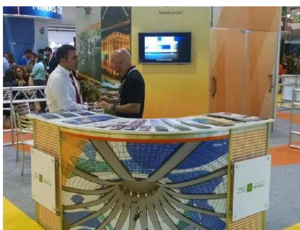
Stand de Brasília

● WTM Latin America (MAR/2016) - Participação na WTM Latin America maior feira internacional de turismo realizada no Brasil, em São Paulo, onde foram realizadas 43 reuniões com operadores e agentes de viagem, além da apresentação de Brasília com a tecnologia de vídeo em 360 graus, a mais moderna maneira de apresentar destinos turísticos. O espaço foi garantido por meio de apoio do MTUR.